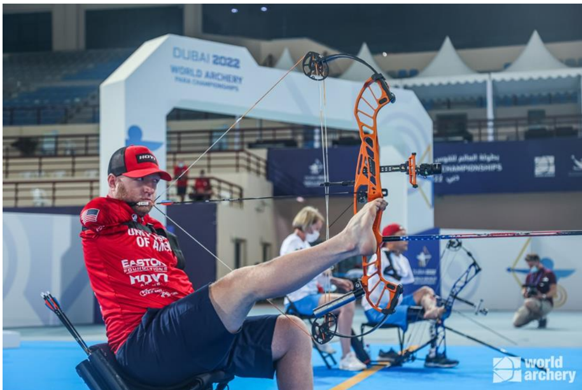
Matt Stutzman (USA)

Matt Stutzman (USA), quien perdió varios puntos en la ronda de clasificación debido a una falla en su equipamiento, se ranqueó en el puesto 54. En la ronda de partidos, sin embargo, Matt venció a sus rivales de Kazajistán, Estados Unidos, Bélgica, Italia, Australia, Irán y la Federación de Tiro con Arco de Rusia para ganar su primera medalla de oro individual en un campeonato mundial. Quesada de Costa Rica tuvo una destacada actuación y se colocó finalmente en la octava posición.