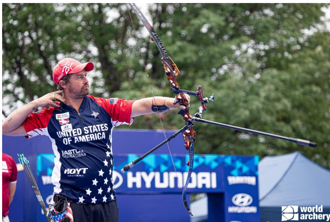
Brady Ellison (USA) – Best QR score in 2021