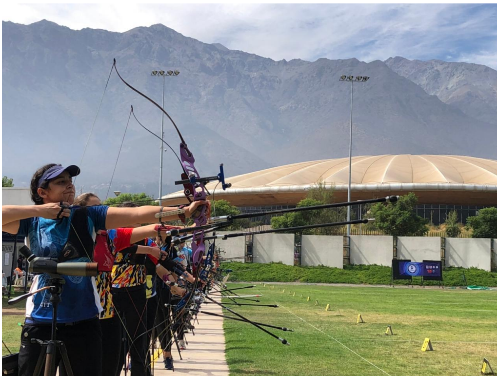
National Championships – Santiago de Chile