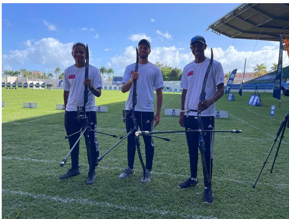
Bermuda's Recurve Men Team at the Puerto Rico Cup