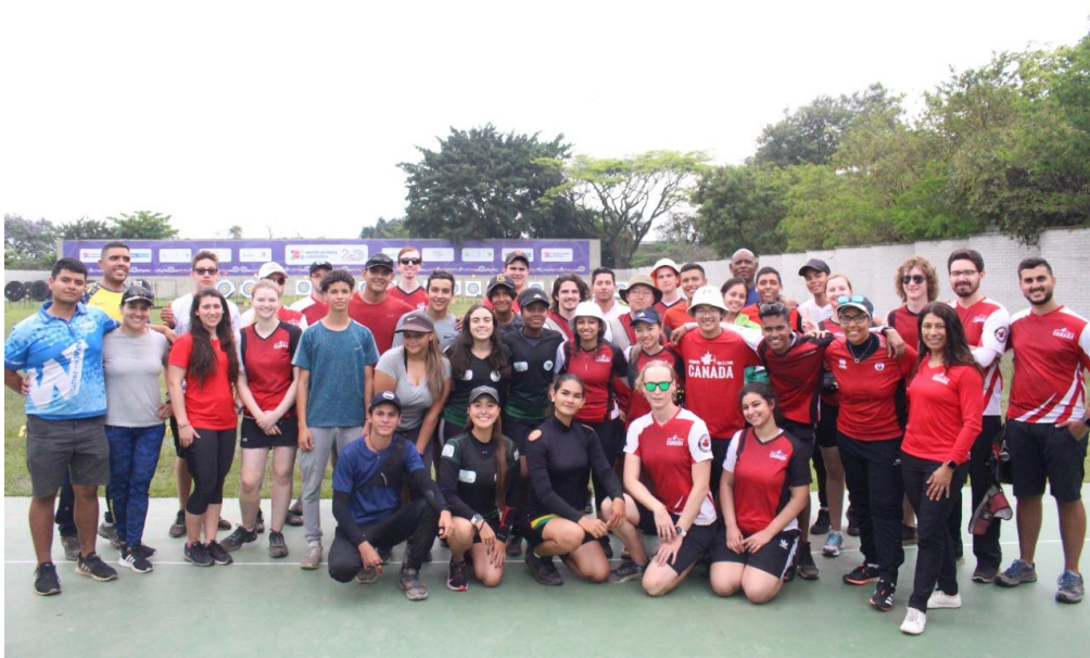
Training Camp of the Canadian Team in Medellín